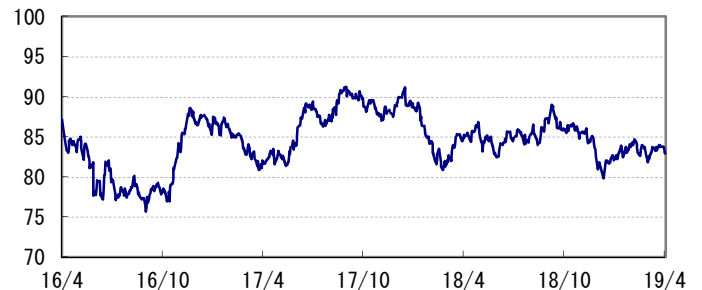
<為替推移 円/加ドル(参考)>

※当レポート中の各数値は四捨五入して表示している場合がありますので、それを用いて計算すると誤差が生じることがあります。